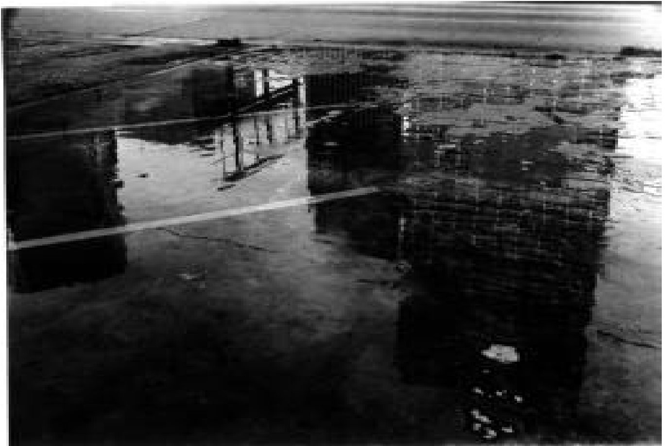
■ FERNELL FRANCO: serie Retratos de ciudad , 1994.