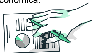
Cuadro 1. Indicadores recientes de la actividad económica

el Producto Interno Bruto estuvo estancado y se ubicó mínimamente por encima del nivel alcanzado en marzo de 2022. A continuación, el Cuadro 1 resume varios indicadores de la actividad económica.