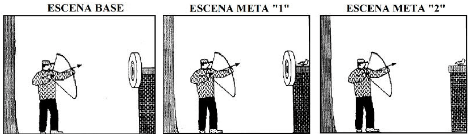
Figura 3. Ejemplo de materiales empleados para determinar qué tipo de diferencias (alineables o no alineables) cuentan más durante los juicios de similitud (adaptado del artículo “Commonalities and differences in similarity comparisons”, de A.B. Markman y D. Gentner, 1996, Memory & Cognition , 2, p. 242)

El procesamiento de analogías bajo una categoría relacional de esquema no siempre requiere que esta sea provista de manera externa. Como han demostrado Minervino et al. (2013), las categorías relacionales de esquema pueden activarse naturalmente en las personas a partir de las situaciones comparadas. De hecho, durante la construcción de materiales del presente estudio nos ha resultado difícil idear situaciones en las cuales la categoría relacional de esquema que proveeríamos a los participantes en la condición categoría relacional de esquema , no fuera automáticamente evocada por los participantes en la condición relación .