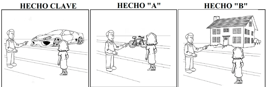
Figura 1. Ejemplo de una analogía en la que el hecho base (clave) y las situaciones meta (Hechos A y B) poseen relaciones similares, pero con diferencias de tipo general entre sus objetos

B (dos casos en los que se señalan objetos diferentes). La escasa evidencia empírica disponible brinda apoyo a los postulados de la teoría de la proyección de la estructura (Gentner y Kurtz, 2006; Gentner, Ratterman y Forbus, 1993), ya que muestra que durante la evaluación de una analogía las personas se centran en la similitud entre las relaciones, mientras que sus juicios prácticamente no se ven afectados por la similitud existente entre las entidades de las situaciones comparadas.