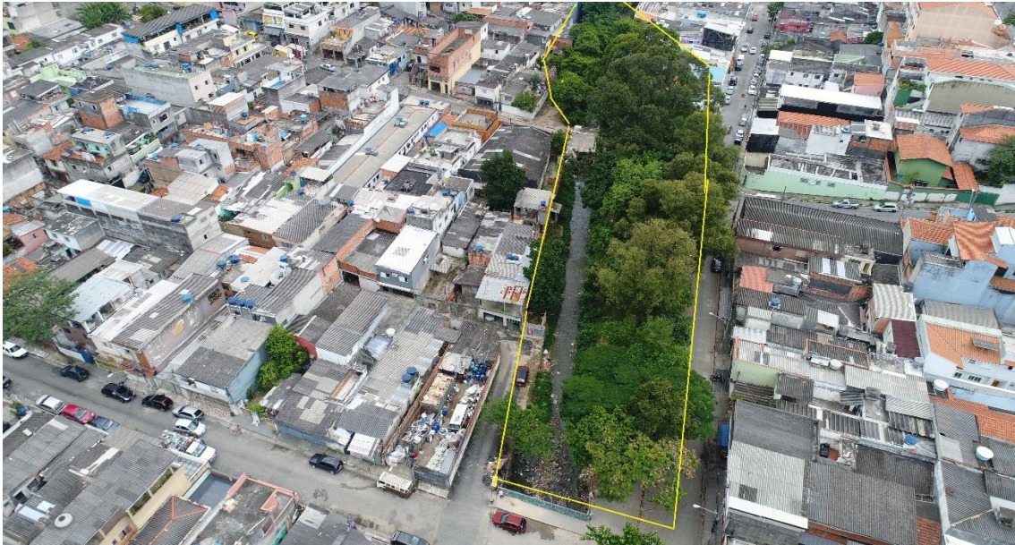
Figura 4. Mata ciliar do Córrego Mirassol minimamente preservada. Adaptado de Defesa Civil da Cidade de São Paulo (2018).

Na Figura 5 observa-se a instalação de moradias sobre o leito do Córrego. Os moradores lançam seus efluentes diretamente sobre o Córrego, muitas vezes lixo também é depositado nas margens. O fato em questão é uma discussão da qual é possível serem abordados os temas de vulnerabilidade social e preservação ambiental. Levantar questões sobre os temas que levam pessoas a se sujeitarem morar em áreas de risco.