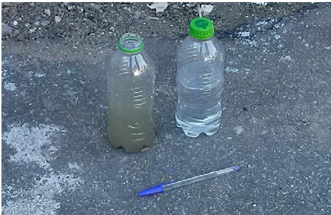
Figura 6. Comparação de amostras de água coletadas no Córrego Mirassol e Ipiranga, respectivamente. Foto realizada em 25 Abr 18.

Desta maneira, é possível conscientizar os alunos sobre diferentes abordagens, como: poluição, falta de planejamento urbano, descaso dos moradores e autoridades competentes para com o problema, dentre outros.