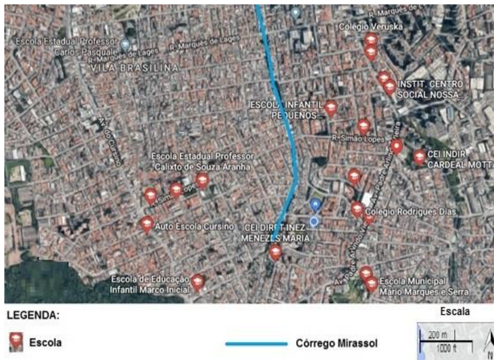
Figura 3. Mapa de localização de escolas na região do Córrego Mirassol. Adaptado pelo autor de Google Earth (2018).

Na Figura 3 observa-se a localização de escolas um raio de 2 Km das margens do Córrego Mirassol.