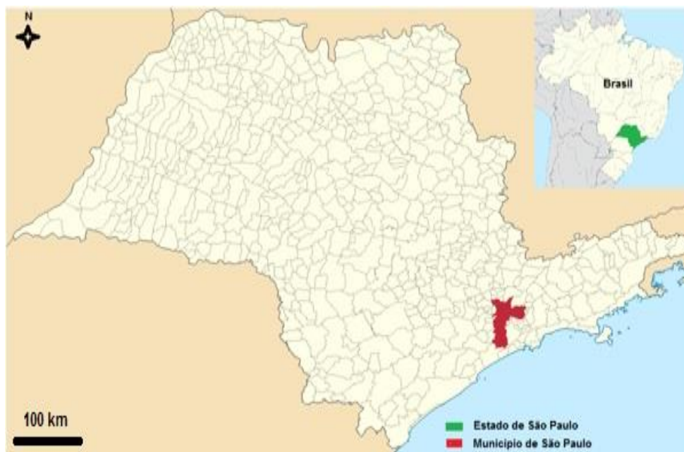
Figura 1 - Mapa de localização da cidade de São Paulo. Recuperado de: http://www.mapeiasp.sp.gov.br/Mapa Adaptado pelo autor.

Em análises de IBGE (2010) totalizando 14.590 km 2 , o distrito Sacomã abrigava 247.851 habitantes ou 53,2% da Prefeitura Regional do Ipiranga (Ipiranga, Sacomã e Cursino), resultando numa densidade demográfica de 17.454 hab/km 2 . Na Figura 1 observa-se a localização do município de São Paulo.