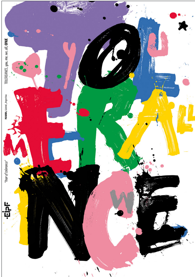
TOLERANCE.you, me, we, all, one (2019) (Mahia-Campo) Cartel por invitación al (EIPF) Emirates International Poster Festival Tema: "The Year of Tolerance"