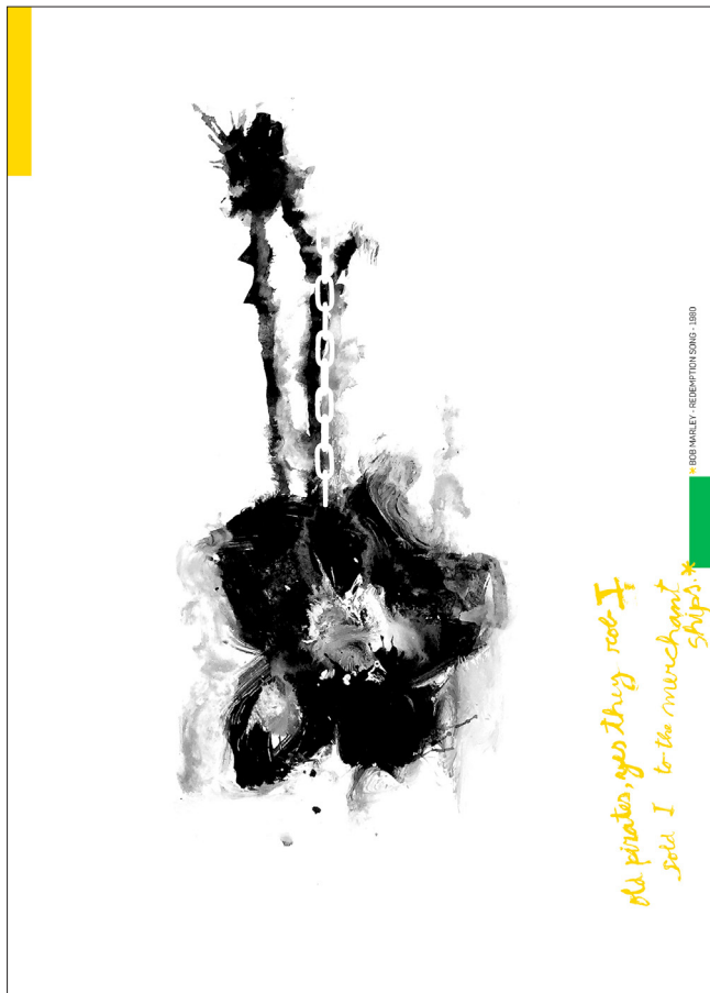
YES THEY BOB I (2021) (Mahia-Campo) Cartel en contra de la trata de personas