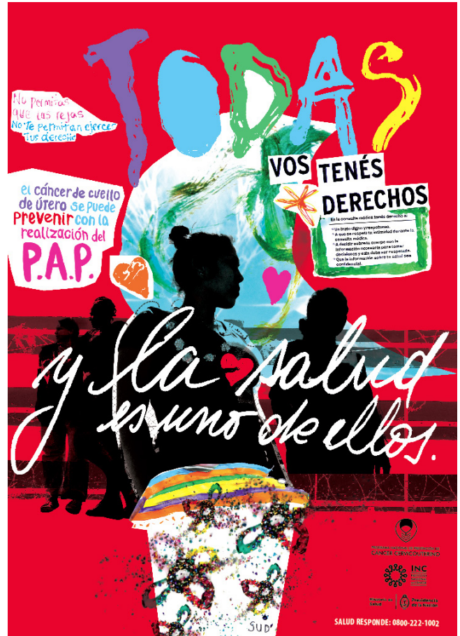
TODAS TENEMOS DERECHOS (Mahia-Campo) Cartel Ministerio de Salud de la Nación Programa Nacional de Prevención de Cáncer Cervicouterino Complejo Penitenciario Federal IV de Mujeres Ezeiza, Provincia de Buenos Aires, Argentina