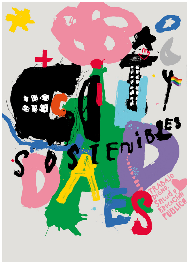
CIUDADES SOSTENIBLES (2019) (Mahia-Campo) Cartel en favor de las Ciudades Sostenibles seleccionado y expuesto en MadridGráfica, España