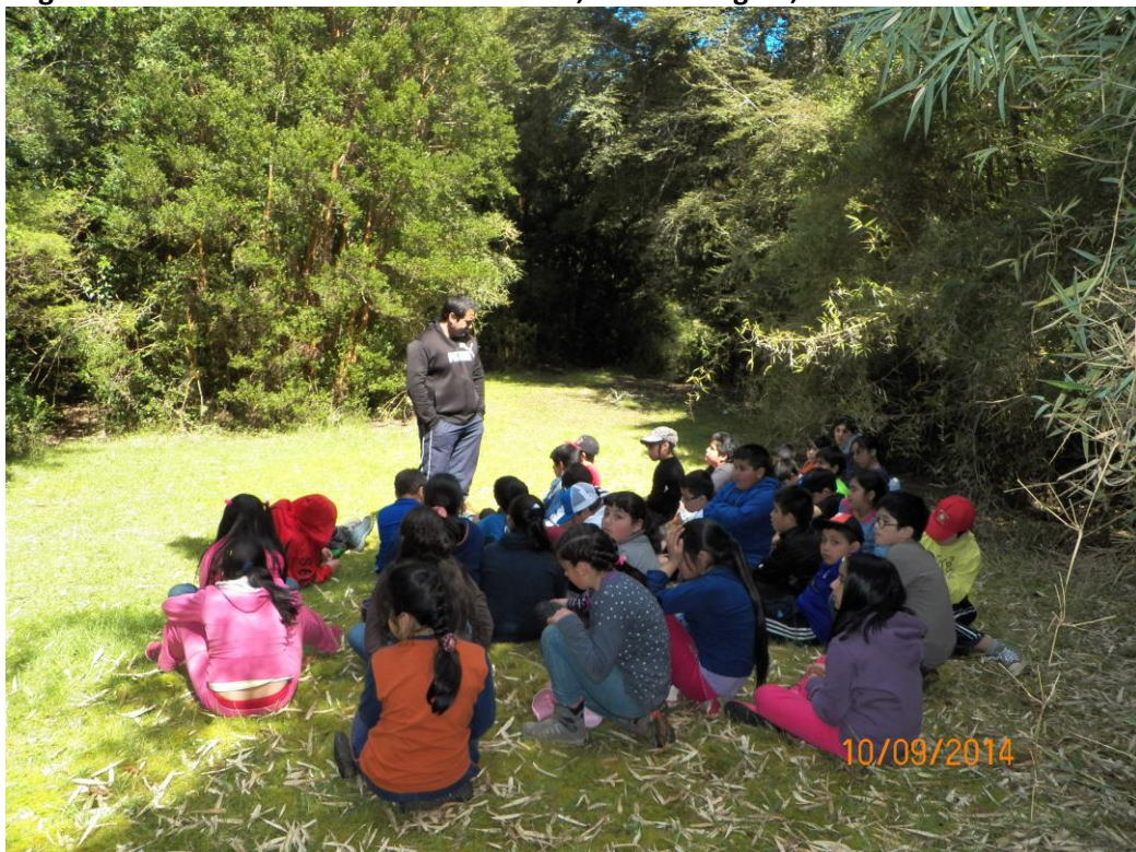
Imagen 2. Actividad con Cuarto Básico en torno al protagonismo de la Niñez. Comuna de Dalcahue, Rio Butalcura