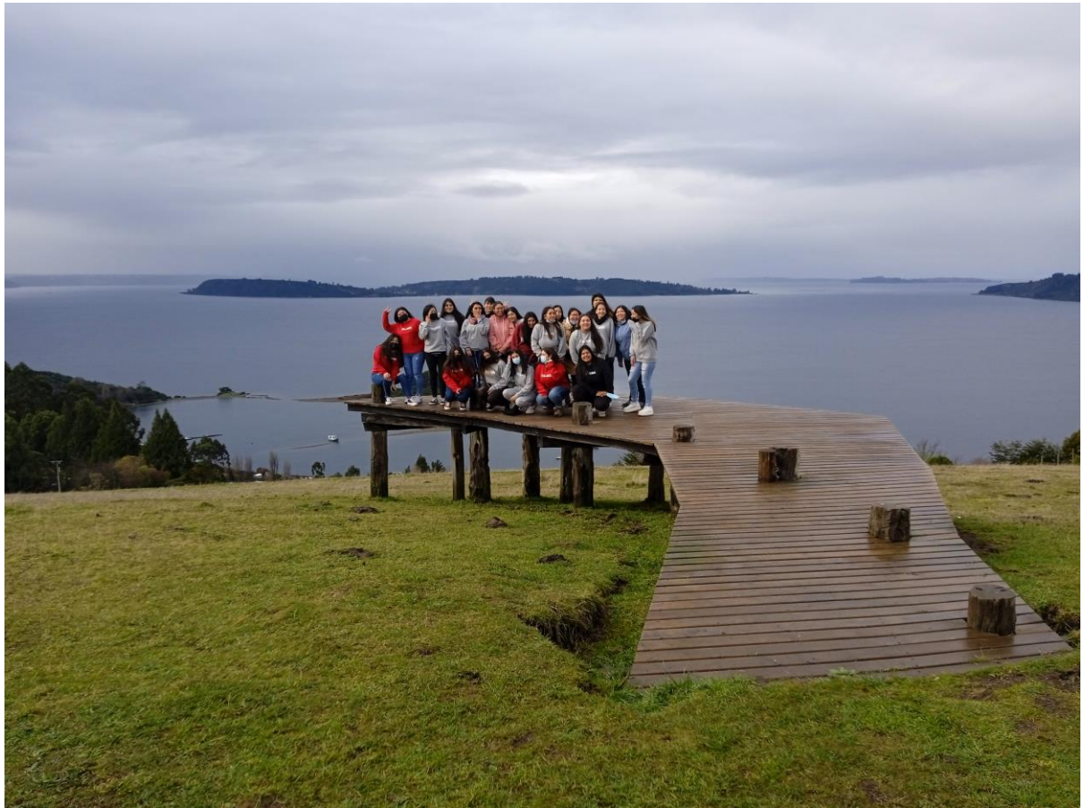
Imagen 7. Actividad formativa para Técnico en educación de Párvulos de la Universidad de Los Lagos, Tema: Participación y protagonismo de la Niñez. Lugar: Muelle de Los Chonos, Sector Tolkien. Comuna de Curaco de Velez, Décima Región, Chile