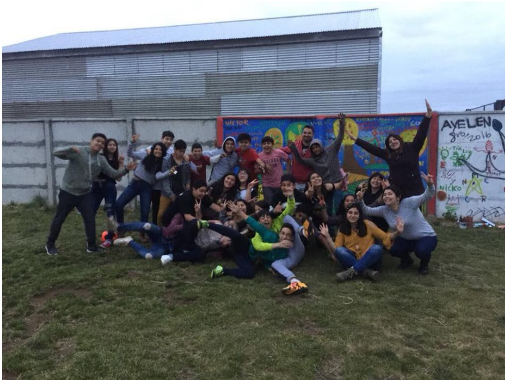
Imagen 5. Actividad del plan de Convivencia Escolar. Curso Octavo Básico. Colegio Ayelen. Comuna de Dalcahue, Décima Región, Chile