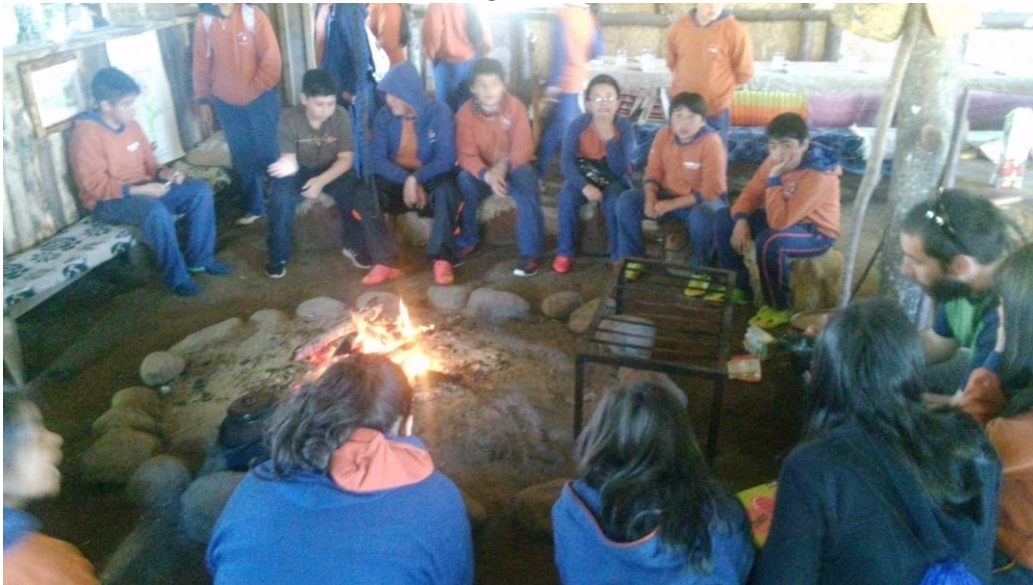
Imagen 4. Actividad del plan de Convivencia Escolar. Curso Quinto Básico, Sector Linao. Comuna de Ancud, Décima Región, Chile