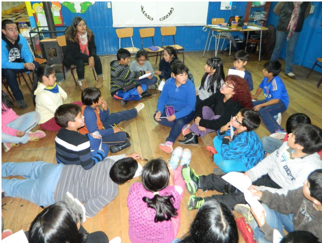
Imagen 1. Conversatorio de diagnóstico participativo con niñas y niños de Quinto Básico. Colegio Wanelen We de la comuna de Castro, Décima Región, Chile.