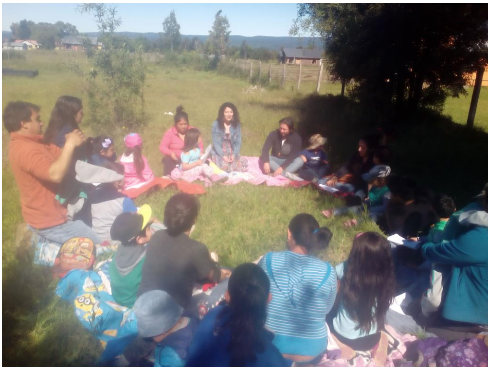
Imagen 6. Actividad del plan de Convivencia Escolar. Curso Kinder, Sector Carihueico. Comuna de Dalcahue, Décima Región, Chile