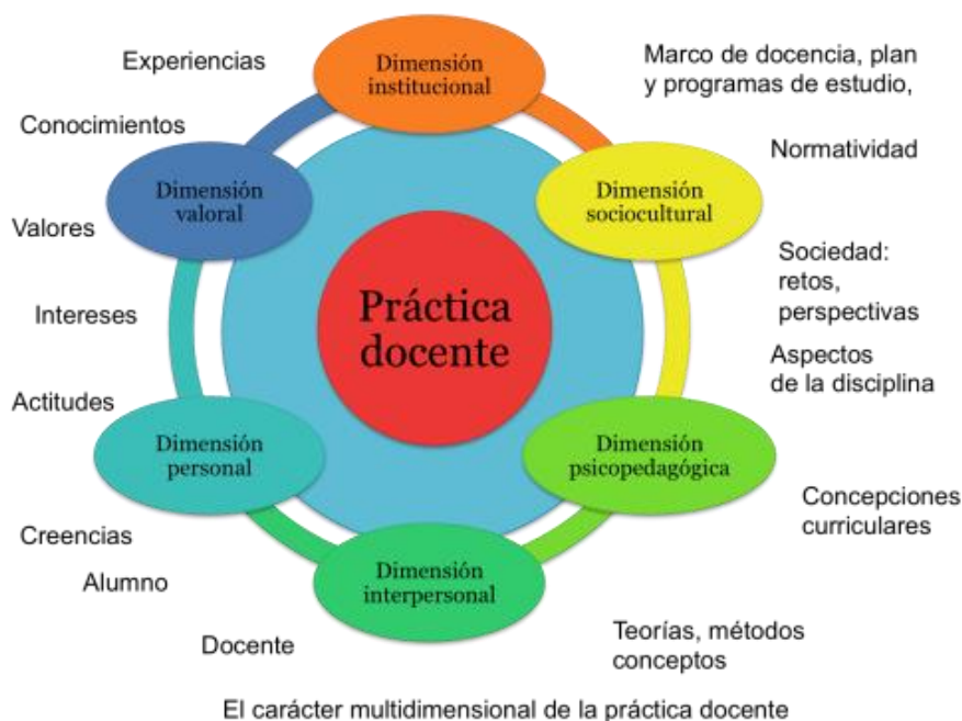
Ilustración 1- Dimensiones de la práctica docente

El perfil del educador hoy en día apunta a una enseñanza orientada a la producción lógica de conocimientos, desde una participación del estudiante invitándolo a discutir sus ideas y a compartir sus saberes, dejando de lado la monotonía y los procesos mecánicos y repetitivos que encasillan al estudiante en un rol tradicional.