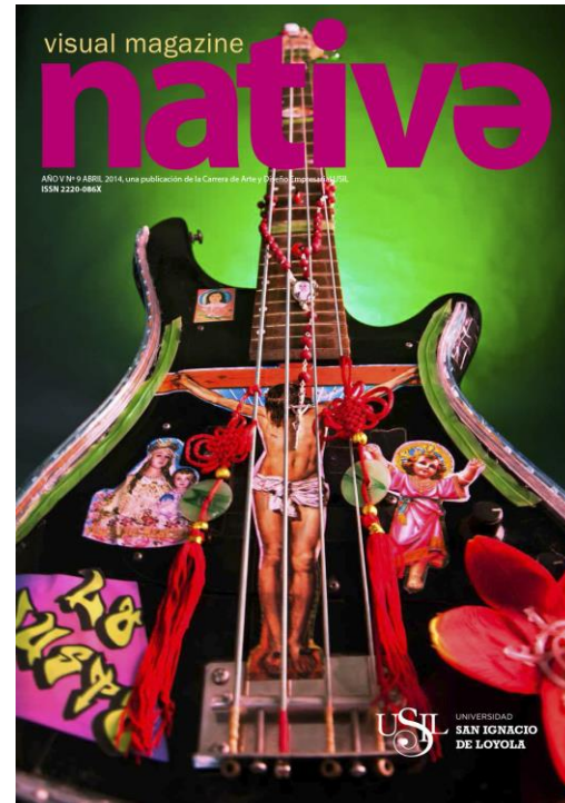
Figura 3 NATIVA 2013 tema: transporte público Figura 4 NATIVA 2014 tema: chicha

El proceso fotográfico por parte de los alumnos participantes empieza con una investigación seria y profesional del tema propuesto seguido de un análisis y discusión que permitan encontrar y definir los diversos ángulos desde donde se puede observar el tema y poder así llevar a cabo un trabajo de campo en donde se realizarán fotografías localizadas en el lugar donde suceden los hechos; o proponer de otra manera, fotografías producidas en estudio bajo un enfoque de propuesta artística o conceptual. En cualquiera de los casos el hecho mismo de tener que realizar unas tomas fotográficas de determinado tema permite al alumno poder acercarse más a esa realidad que está a su costado y que en muchos casos no ve o que simplemente ignora. No solo difundir al público en general lo que sucede en