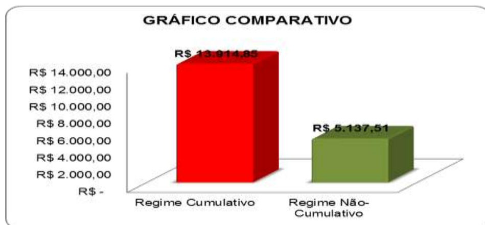
Figura 8. Gráfico comparativo dos tributos pagos no 1º semestre de 2016.

Abaixo será demonstrado um gráfico comparativo, para uma real análise da economia que a empresa obteve em um período de seis meses, dessa forma, chegando ao desfecho através de uma simples análise da qual seria a melhor opção tributária para a empresa atuar.