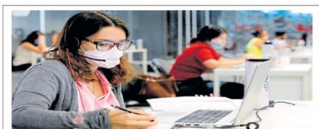
Estudiantes. La jornada de 6 horas en los call centers resulta atractiva para los jóvenes que estudian.