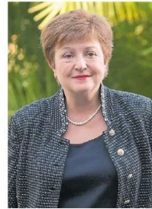
Amable. La titular del FMI, Kristalina Georgieva, muestra buena predisposición con la Argentina, pero sin acuerdos a la vista.

En un contexto caracterizado por la premisa marplatense de "billeteo mata galán", el Gobierno se